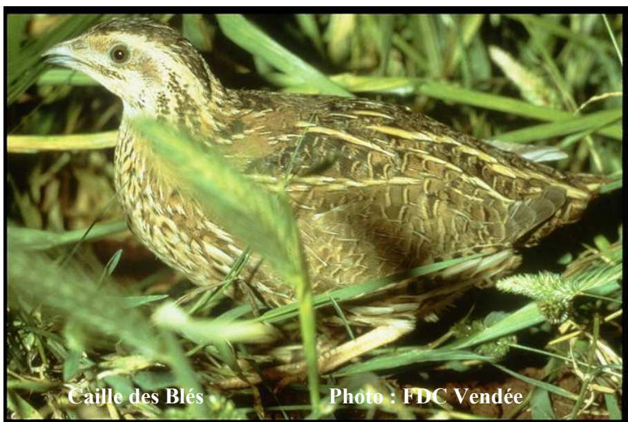
Caille des Blés